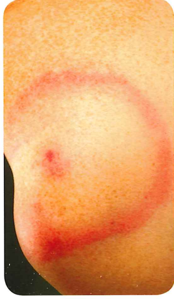
Rode ring op de huid

Als je de ziekte van Lyme hebt, dan krijg je vaak een rode ring om de plek waar je bent gebeten. Maar dit is niet altijd zo.