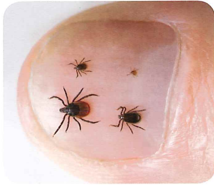
Teken op een duim

Teken zijn heel kleine beestjes. Ze lijken op spinnetjes.